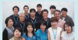
2024年企画会議メンバー

現在のレゾナックがステークホルダーの皆さまへ、今、お伝えすべきことは何なのか。企業価値向上に向け取り組んでいる施策について議論し、コンテンツを決定