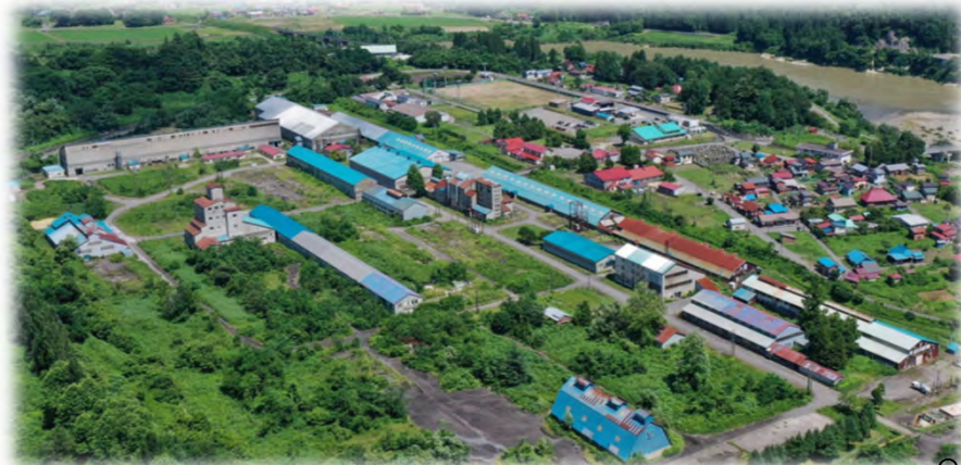
ドローンによる工場全体及び 本事務所周りの最新空撮写真