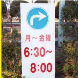
特別運用の看板表示