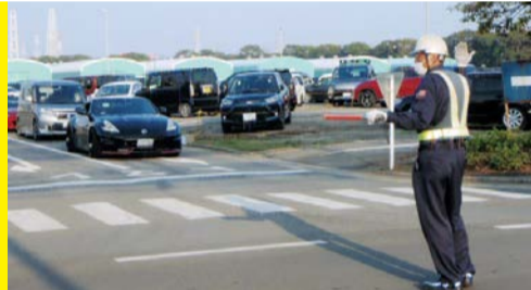
警備員による交通整理状況