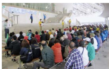
荒川所長によるご挨拶