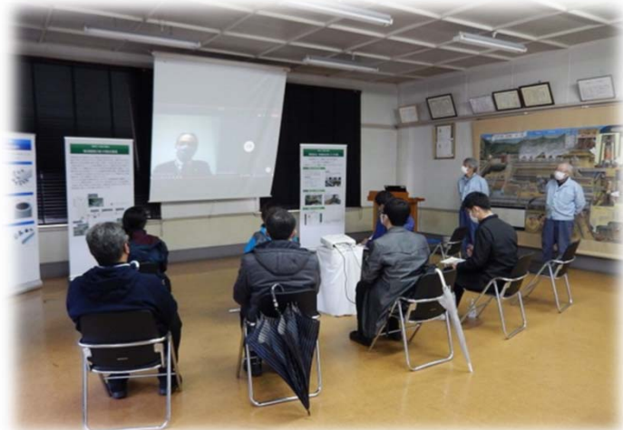
(左上) 2020年7月28日 阿賀町教職員様