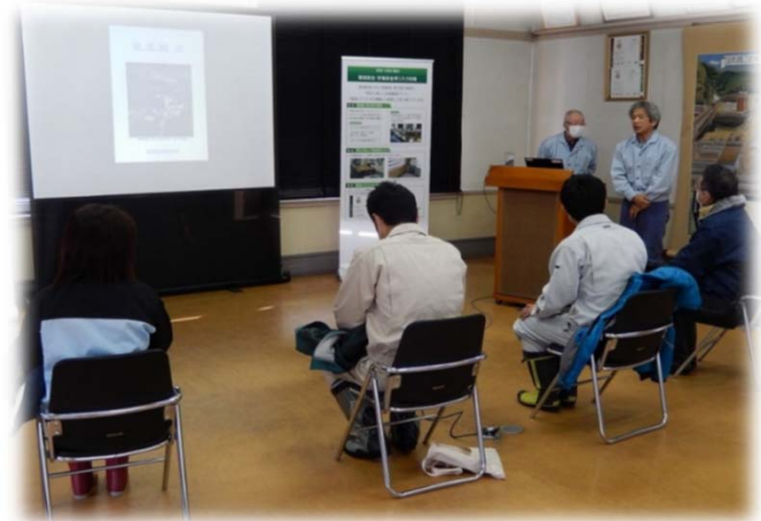
(右上) 2020年12月24日 新発田環境センター様