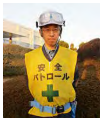
武宮環境安全グループリーダー

1月6日付けで、地域対話、ミニ集会、環境モニターの事務局を担当している環境安全部を含む大分コンビナートの組織改定を行いました。新たな環境安全グループリーダーの下、環境管理、安全管理のより一層のレベルアップを図ってまいります。