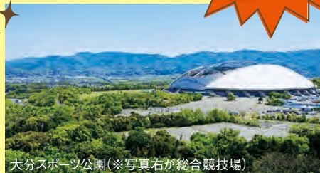
大分スポーツ公園(※写真右が総合競技場)

昭和電工株式会社は、大分スポーツ公園内の施設について、大分県よりネーミングライツ(命名権)を取得しました。