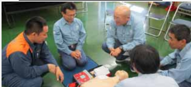
緊急救命講習会(AED操作を含む)

緊急時に備え、救命訓練を実施しています。本年は、周南市消防本部より講師を招き、講習会を行いました(9/18)