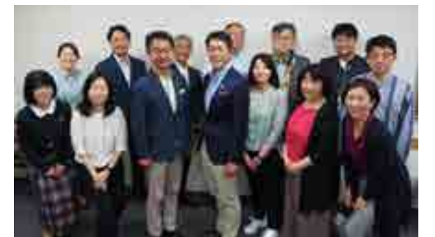
統合報告書企画会議メンバー