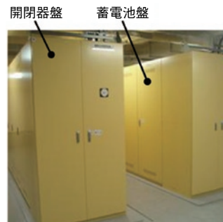
図3 納入したりチウムイオン電池システム

システム全体としては16電池盤を1セットとするブロックが6セット並列に設置されている。PCSと統括BMUの間で通信を行い、全ての電池の監視情報がホストシステムAEMSに通知される。統括BMUは、万が一何れかの電池盤が故障した際に、当該電池盤を切り離した状態で運転を継続する縮退運転機能も備えており、稼働率低下を防止する。