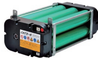
図4 定置用途リチウムイオン電池パック“CH75-6”